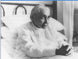
De Dienares Gods Luisa Piccarreta

Kerstnoveen (4 de dag) 2020 www.luisapiccarreta-goddelijkewil.org