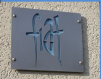
Huis van de Goddelijke