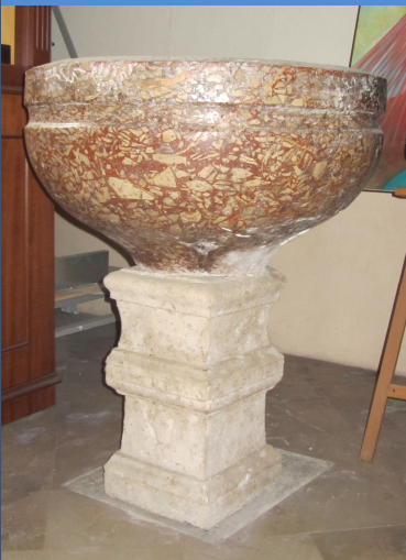
Doopvont Luisa Piccarreta Chiesa Matrice Corato

Beste vrienden, met het overwegen van de vrijheid in het Licht van de Goddelijke Wil ontdekken we onze identiteit en het liefdevolle doel waartoe de Heer ons uit het niets schiep. De vrijheid biedt ruimte aan de Schepper die Zijn schepsel bekleedt met wat hij bezat. Zo bezit hij de vleugels om zich te verheffen boven de aarde en het doel te bereiken waartoe God hem de vrije wil gaf. Hoe onbegrijpelijk is dit voor de menselijke geest, zeker bij een onstandvastig geloof.